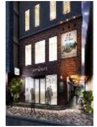
『GEMS 名駅三丁目』 2024年5月開業 『GEMS 六本木』 2021年11月開業 『GEMS 中目黒』 2021年4月開業 『GEMS 川崎』 2021年3月開業 『GEMS AOYAMA CROSS』 2020年9月開業 『GEMS HIROO CROSS』 2020年7月開業